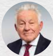
Landesobmann LH a. D. Dr. Josef Pühringer